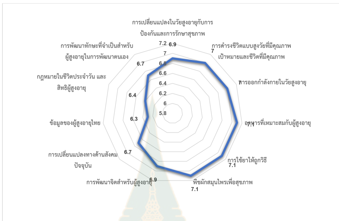
ภาพที่ 5.2 ระดับการประเมินตนเองในระดับความรู้ในเรื่องต่างๆ ของผู้สูงอายุ

ระดับความรู้เรื่อง que ผู้สูงอายุกู้รู้ในระดับน้อยสุด คือ ข้อมูลผู้สูงอายุไทย, กฎหมายในชีวิตประจำวันและสิทธิผู้สูงอายุ และระดับความรู้ที่มากที่สุด พืชผักสมุนไพรเพื่อสุขภาพ, เรื่องของการใช้จ่ายให้ถูกวิธี และเรื่องอาหารที่เหมาะสมกับผู้สูงอายุ